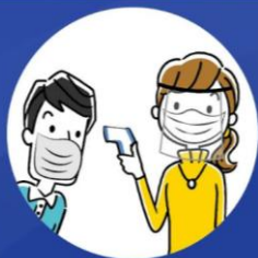
Toma de temperatura corporal