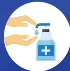
Utilizar alcohol en gel

Tomando en cuenta las indicaciones del Ministerio de Salud Pública y Asistencia Social -MSPAS- y de Salud y Seguridad Ocupacional de la Subdirección de Recursos Humanos del Registro Nacional de las Personas -RENAP-, en las oficinas registrales a nivel nacional se continúa con la implementación de los protocolos para prevenir el contagio del COVID-19.